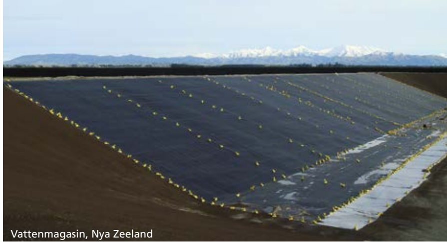
Vattenmagasin, Nya Zeeland