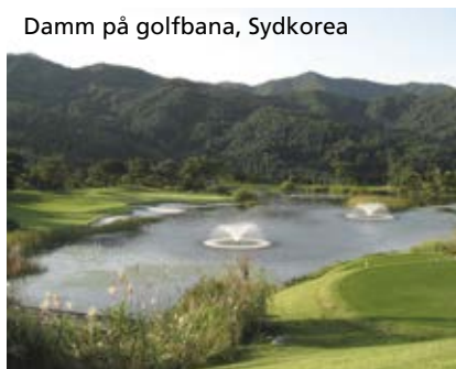
Damm på golfbana, Sydkorea