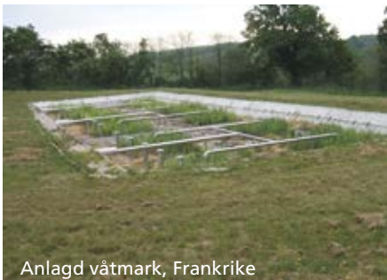
Anlagd våtmark, Frankrike