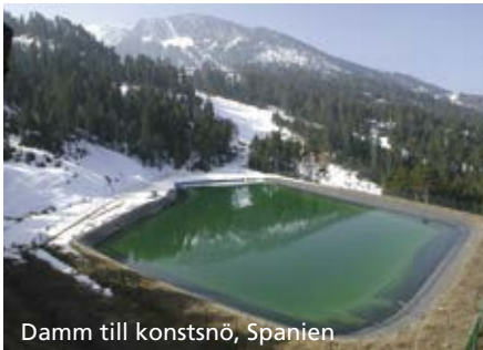
Damm till konstsnö, Spanien